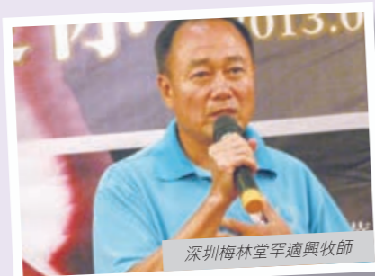
深圳梅林堂罕適興牧師