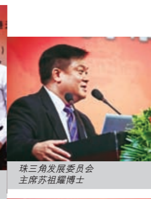
珠三角发展委员会主席苏祖耀博士