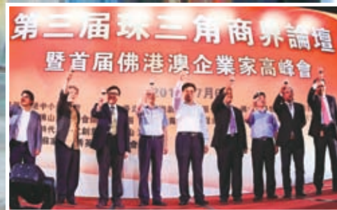
佛港澳企業家高峰會