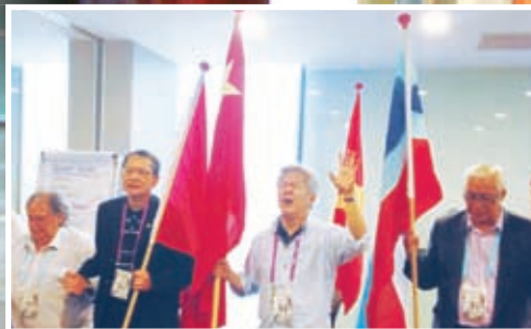
新加坡 - 門訓列國