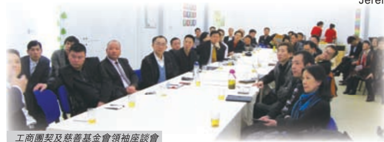
工商團契及慈善基金會領袖座談會