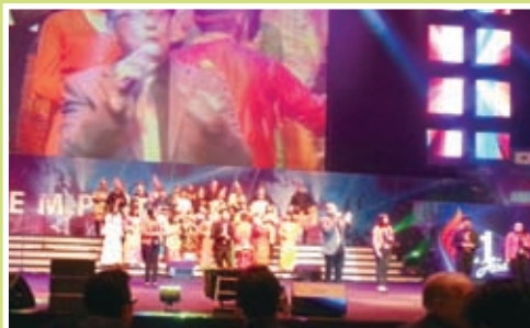
廿一世紀聖靈加力亞洲大會