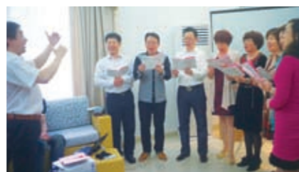
We worship You Almighty God!