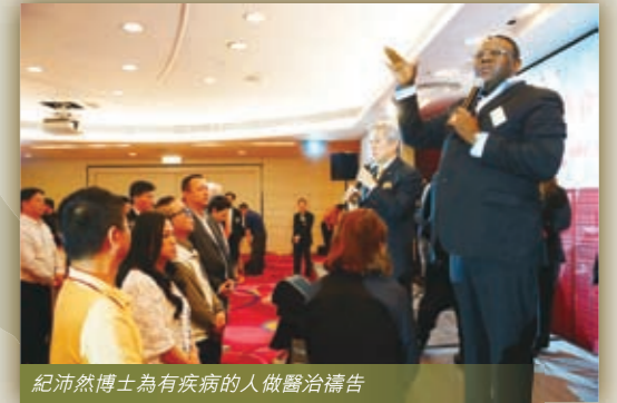
紀沛然博士為有疾病的人做醫治禱告