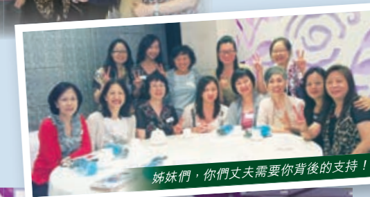
姊妹們，你們丈夫需要你背後的支持！