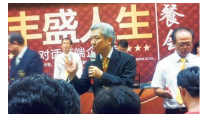
(中)陈律师带领大家祷告