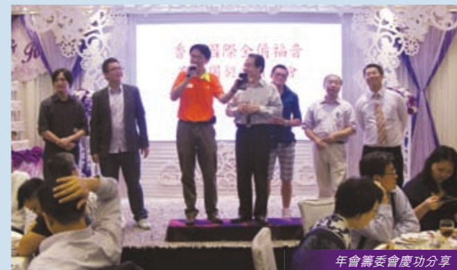
年會籌委會慶功分享