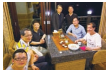
Chaozhou Kungfu tea is great!