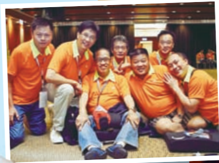
弟兄們興起，發亮光！