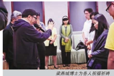
梁燕城博士为各人祝福祈祷