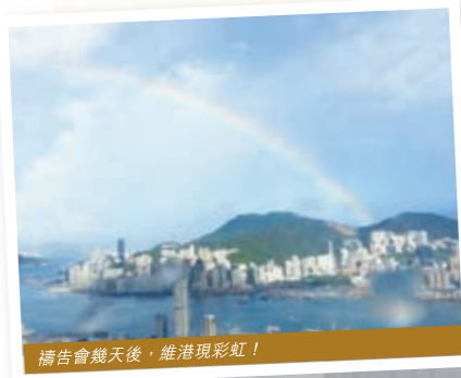
禱告會幾天後，維港現彩虹！