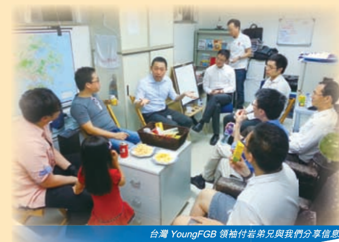
台灣 YoungFGB 領袖付岩弟兄與我們分享信息