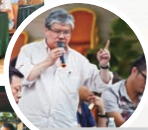
企业家在台下发问