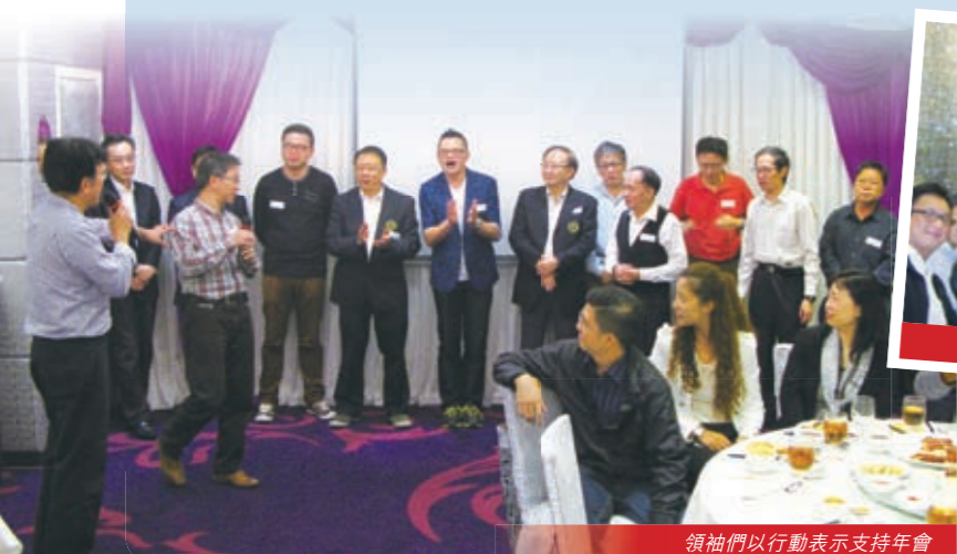
領袖們以行動表示支持年會