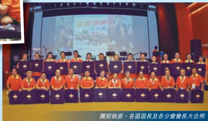
團契執委、各區區長及各分會會長大合照