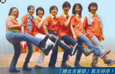
「婦女支援部」我支持你！