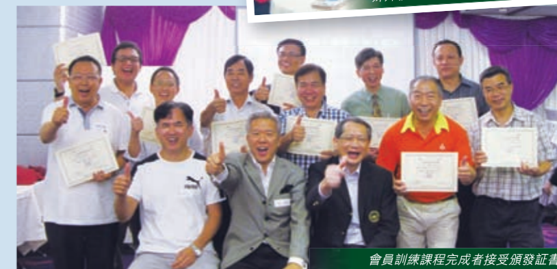
會員訓練課程完成者接受頒發證書

很棒！這次講座可以讓團契弟兄察覺到自己以及別人是否活在壓力之下，能幫助自己更懂得體貼及關心別人。講座內容豐富，因時間關係，只能初步了解，若能有機會再深入探討，相信會更能把握箇中道理，並應用出來。☺