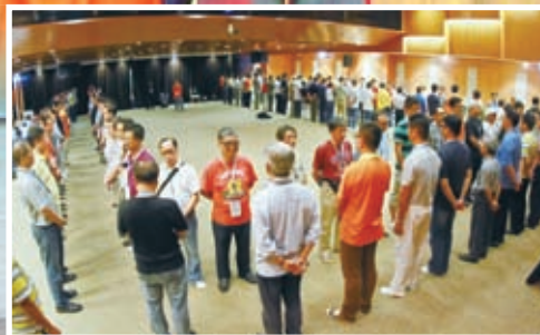
男人營年會 - 全然得勝