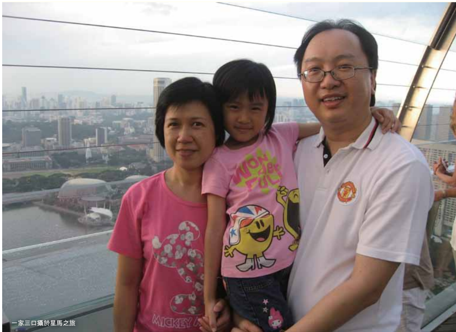
一家三口攝於星馬之旅