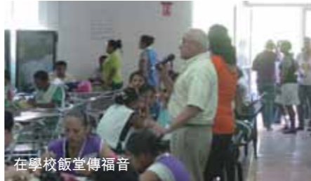
在學校飯堂傳福音