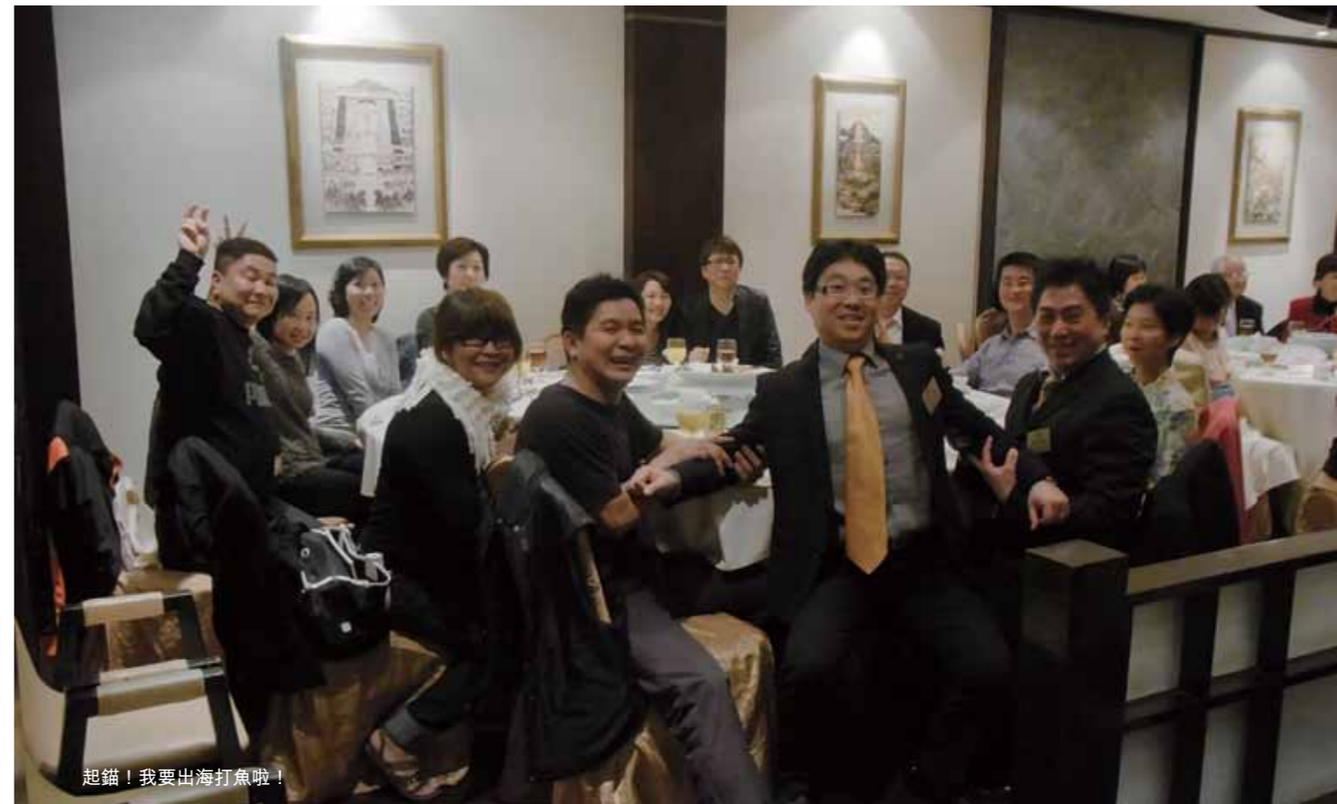
起錨！我要出海打魚啦！