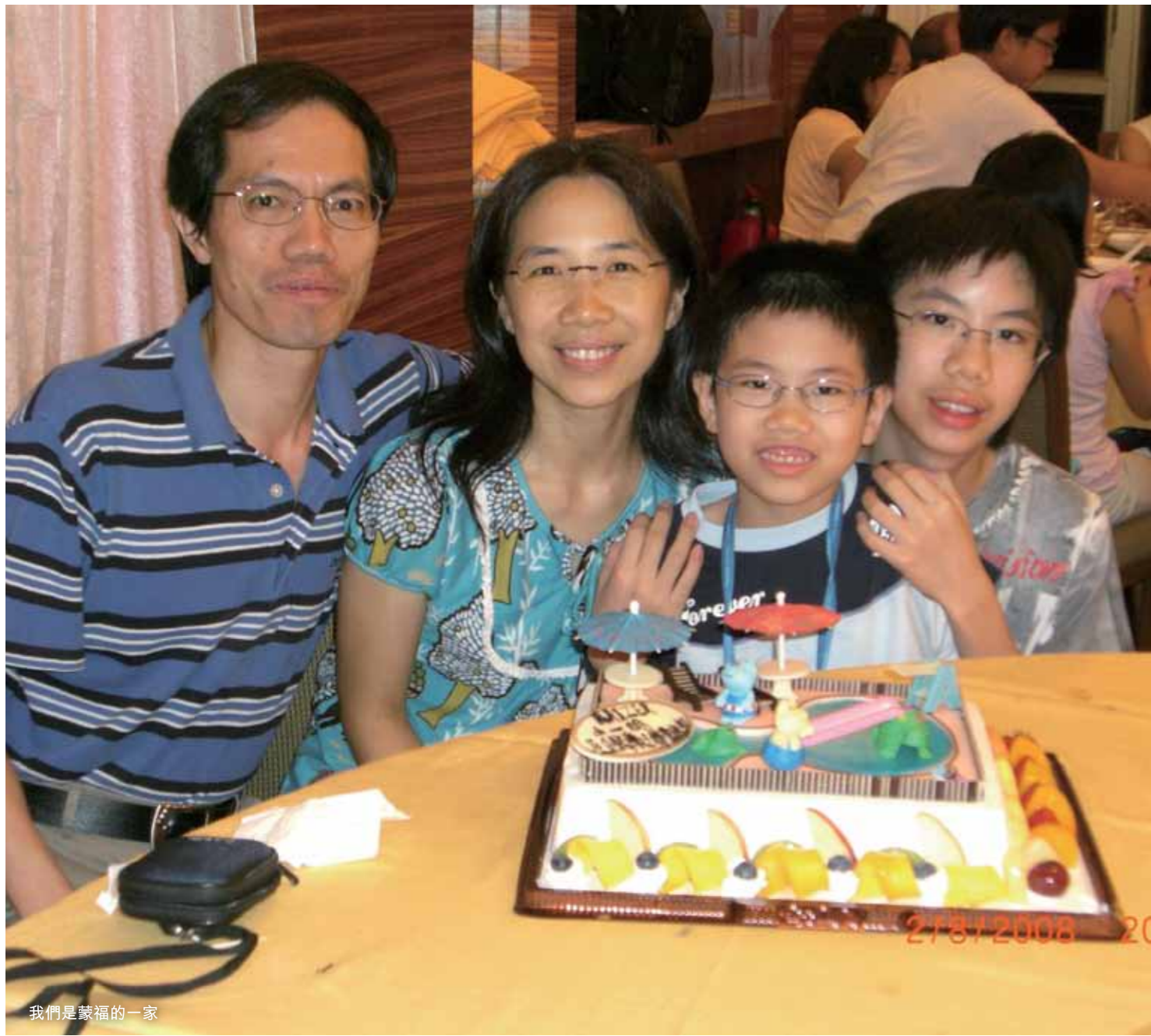
我們是蒙福的一家