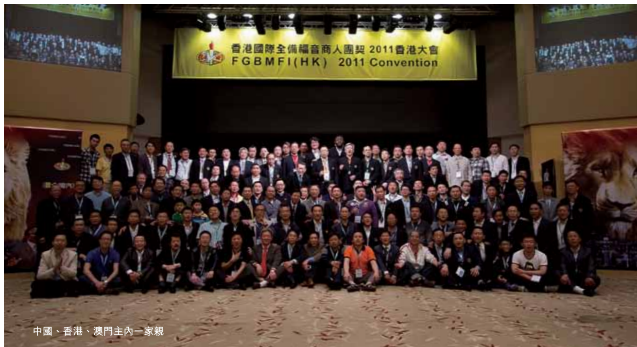
中國、香港、澳門主內一家親