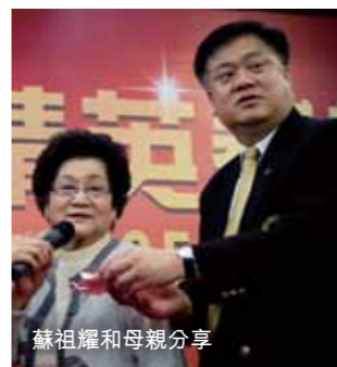
蘇祖耀和母親分享