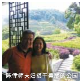
陈律师夫妇摄于美丽的公园