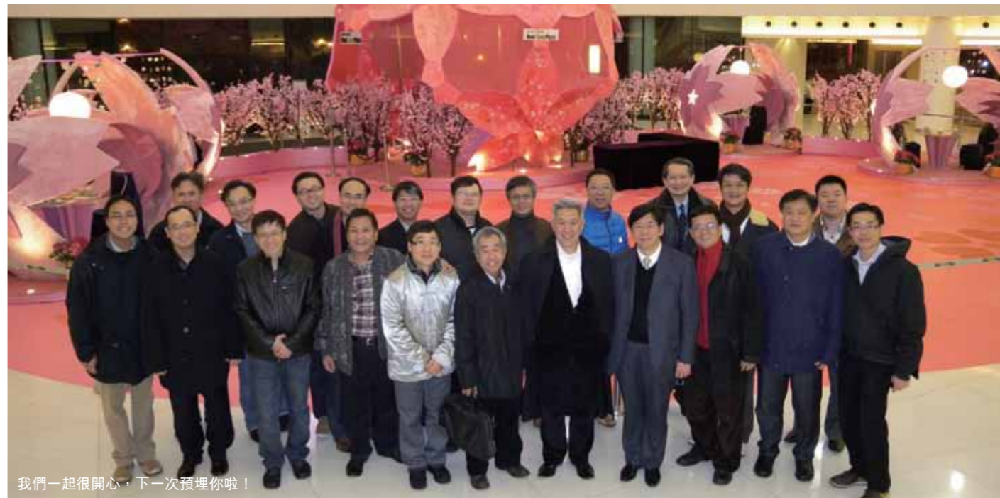
我們一起很開心，下一次預埋你啦！