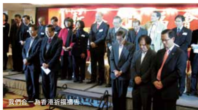
我們合一為香港祈福禱告