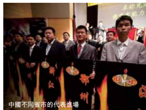
中國不同省市的代表進場