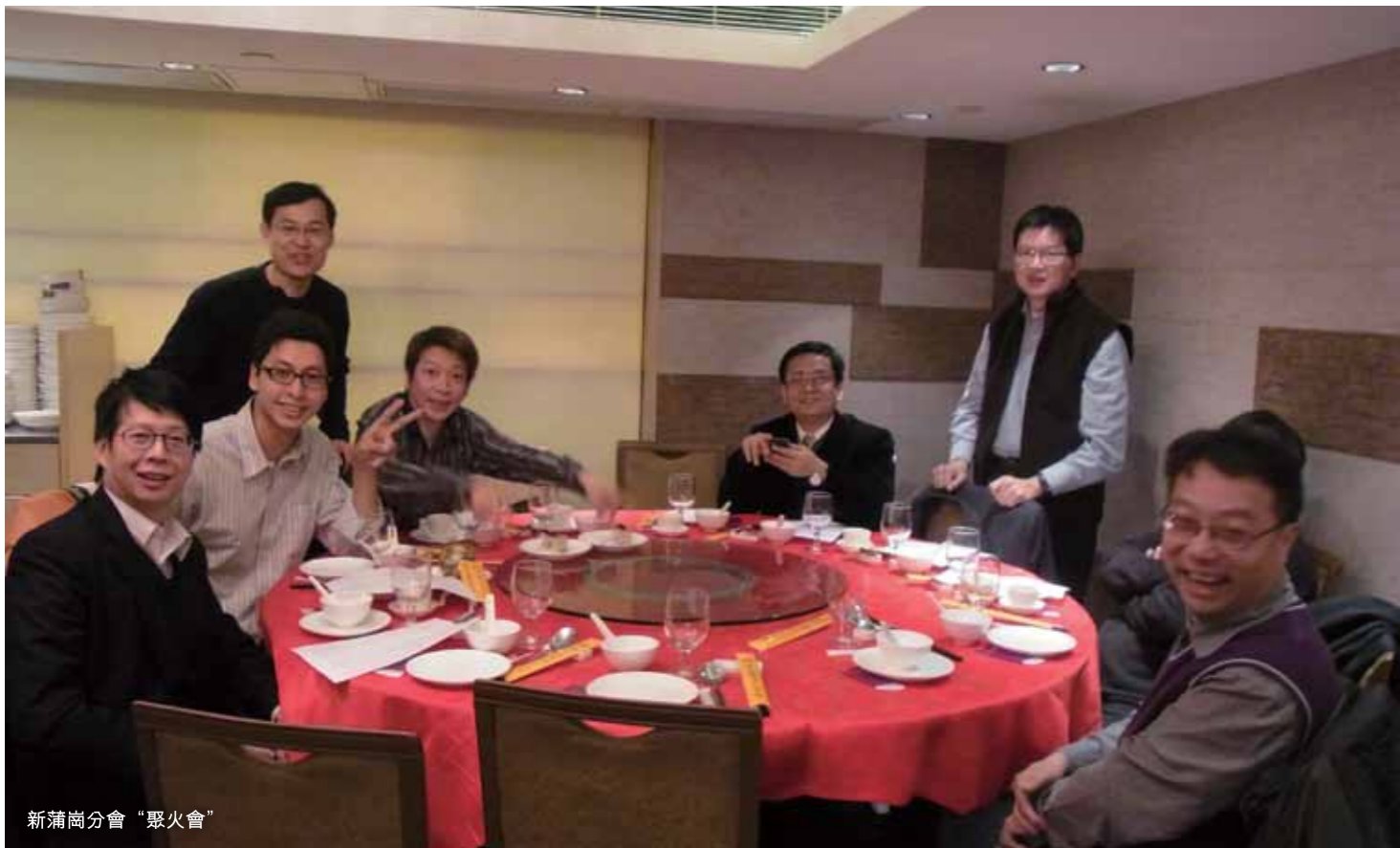
新蒲崗分會“聚火會”