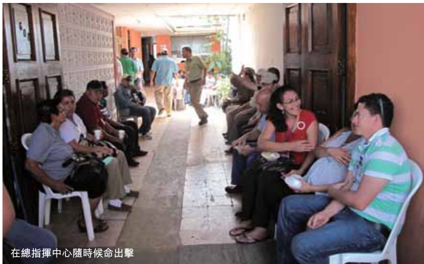
在總指揮中心隨時候命出擊