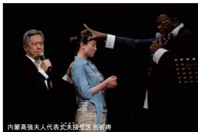
内蒙高强夫人代表丈夫接受医治祈祷

通过那几天短暂的相聚，加深了我们对香港国际全备福音商人团契的了解。内蒙古的基督徒商人灵命需要在团契中成长，