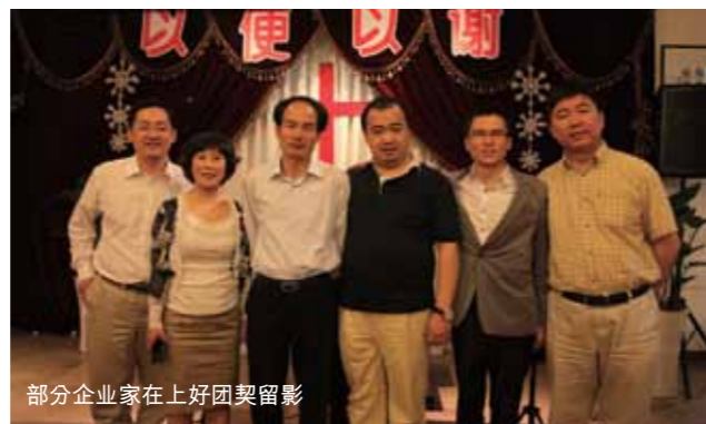
部分企业家在上好团契留影