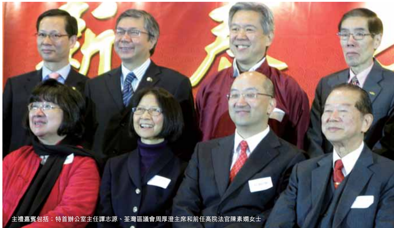
主禮嘉賓包括：特首辦公室主任譚志源、荃灣區議會周厚澄主席和前任高院法官陳素嫻女士