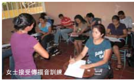
女士接受傳福音訓練