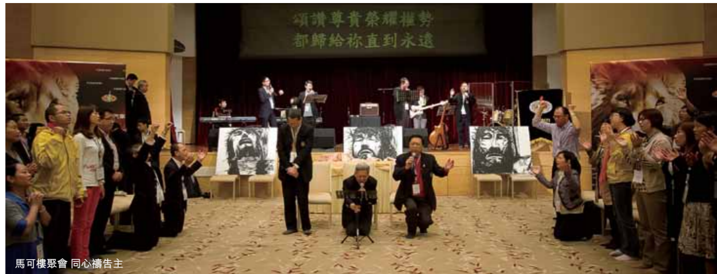
馬可樓聚會 同心禱告主