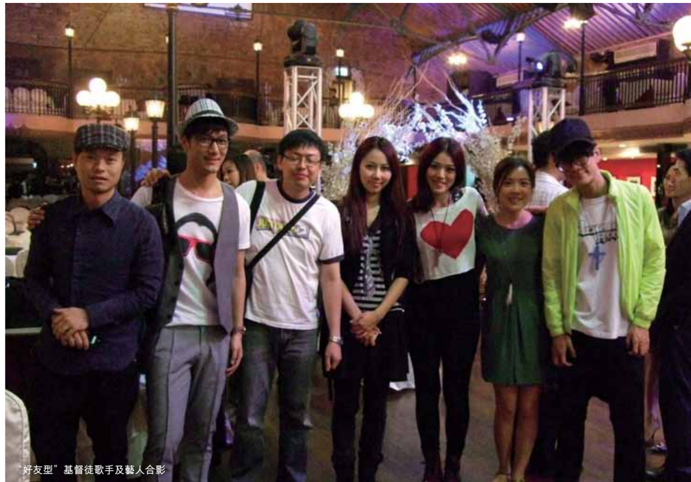
“好友型”基督徒歌手及藝人合影