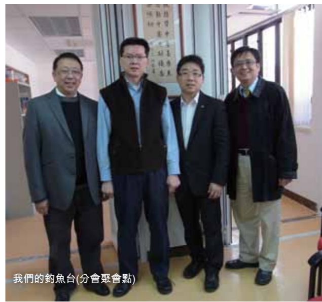
我們的釣魚台(分會聚會點)