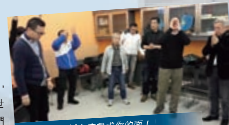
主呀，我們誠心來尋求你的面！

出席這次退修營，總的來說，有三大益處：第一，弟兄之間加深了認識，強化了彼此的關係；第二，此次退修不是事工，而是談心，彼此分享自己的心路歷程。當了解到對方的難處時，我們也學會了多彼此體恤；第三，今次我有很充足的時間安靜下來敬拜禱告、親近主，實在難得。第二天肉體可能有點疲憊，但靈是滿足的。