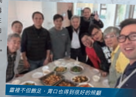
靈裡不但飽足，胃口也得到很好的照顧