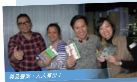
獎品豐富，人人有份！