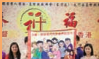
2014年新春祈福會，年青人為香港世代求平安祈福！

今年農曆年初三(二月廿一日)，由鄉村福音使命團、以勒基金及粉嶺基督聖召會主辦、我們商人團契有分協辦的「新春祈福會」，於粉嶺聯和墟和陸路球場順利舉行。當日除宣讀經文頌讚基督外，亦有各界代表為政府、商業、傳媒、演藝、教育、宗教及家庭七大山頭祈福。下午設有攤位遊戲及福音盤菜宴，領鄉村婦老歸主，積極落區傳揚基督天國文化。