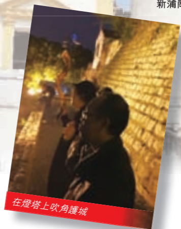
在燈塔上吹角護城