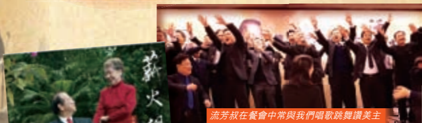
流芳叔在餐會中常與我們唱歌跳舞讚美主