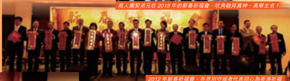
2012年新春祈福會，各界別守城者代表同心為香港祈福