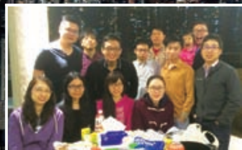
「年青守城者」誕生了！