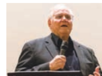
Loren Cunningham was sharing about The Seven Mountains Strategy

Last year God had already spoken to our leadership team that He is reviving Churches and Marketplace Ministries in Shanghai. He moved us to unite pastors from different churches and marketplace leaders together to build a United Prayer Altar, and He told us that He will use Shanghai to revive China. So when brother Loren Cunningham shared with us in our Men's camp 2015