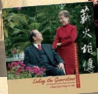
流芳叔兒女子孫為他出版之紀念特刊「薪火相傳」於追思晚宴中送贈親友