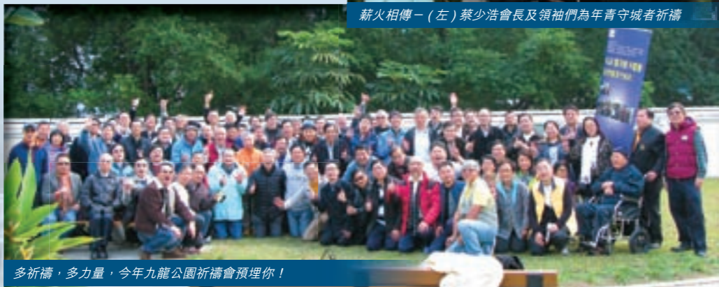
多祈禱，多力量，今年九龍公園祈禱會預埋你！