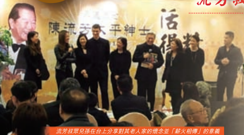
流芳叔眾兒孫在台上分享對其老人家的懷念並「薪火相傳」的意義