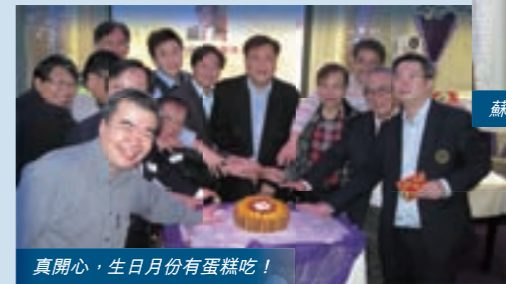
真開心，生日月份有蛋糕吃！

當 晚會員及伙伴的反應非常踴躍，超過 120 人出席。首先是為一月份到三月份生日的會員慶祝生日，接着是團契執委 George 蘇祖耀博士作為嘉賓講員，分享了「2015 國際投資趨勢和創業導向」。他以歷代志上 12 章 32 節為開場白，道出明白神的季節的重要性。因為當我們依靠神，明白神的季節，按祂的時候來辦事時，就可以無懼現實環境的災害與困惑，過得勝的生命。同時，他也分享了一些先知如恰克·皮爾斯 (Chuck Pierce) 從神而來的啟示與領受，當他提到神要祝福中國，在 2026 年成為世界大國時，大家都倍覺份外的鼓舞。