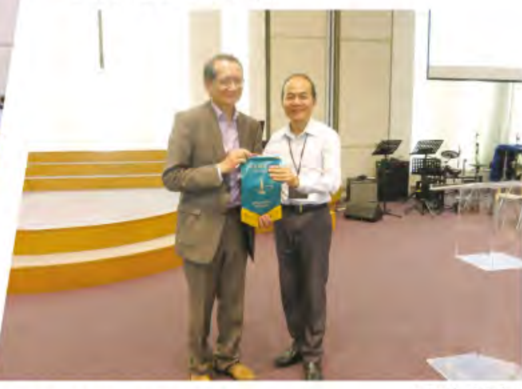
▲張院長(右一)致送紀念品