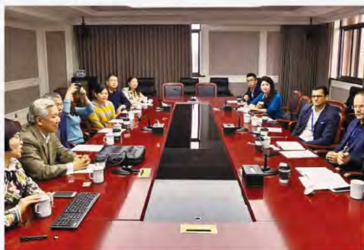
▲ Hugo及Mergon集團訪問著名基督教醫院溫州康寧醫院

大多數人在星期一感到沮喪。但是工作已經被贖回，工作是神喜悅的服事。明白這個，你會說，哈利路亞！又到星期一了！可以上班去了！想一想，如果你沒有金錢報酬，你會工作嗎？我們需要知道如何在基督裡贖回工作真正的意義，將它恢復到上帝的原意。