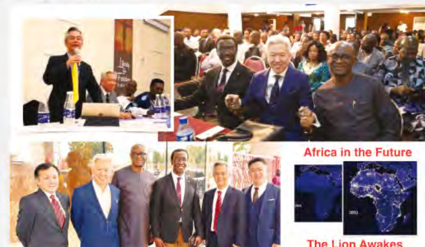
Speaking at Business Forum hosted by FGB Nigeria at Abuja and Lagos ( August 2018) 於尼日利亞FGB之商務座談會分享一帶一路下中非商業合作

讓我們贖回工作和事業的目的。聖靈是與你在一起工作的。聖經記載聖靈首次充滿一個人是在一位名叫比撒列的人身上，目的是他為神的約櫃作巧工！你的工作，是盛載神同在和能力的器皿！帶耶穌上班吧！