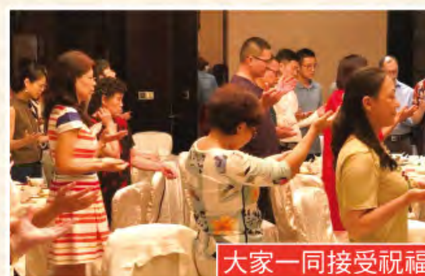
大家一同接受祝福