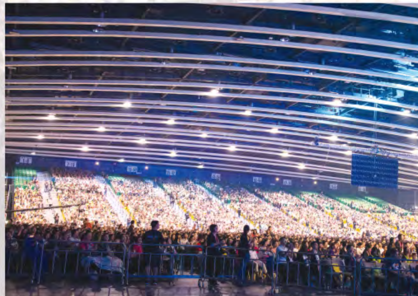
特會在香港會議展覽中心舉行

5月11-12日馬都納多牧師 (Apostle Guillermo Maldonado)與他的耶穌君王使團 (King Jesus Ministry) 首次造訪香港。馬都納多牧師是著名的佈道家，耶穌君王國際事工 (King Jesus International Church) 創辦人，一直致力於世界各地進行佈道及醫治工作，足跡遍佈美洲、非洲及東南亞等70多個國家。他這兩天在香港會議展覽中心舉辦的特會，透過信息分享，開啟弟兄姊妹與神超自然的相遇，藉著親身的見證，將福音的大能帶到家庭、學校與工作當中，發揮更大的影響力。