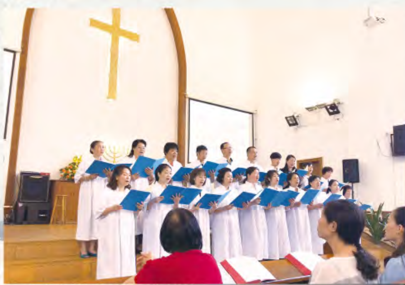
▲ 在中山參加員峰堂主日崇拜