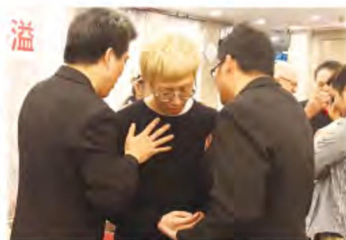
▲FGB 弟兄為來賓祈禱醫治