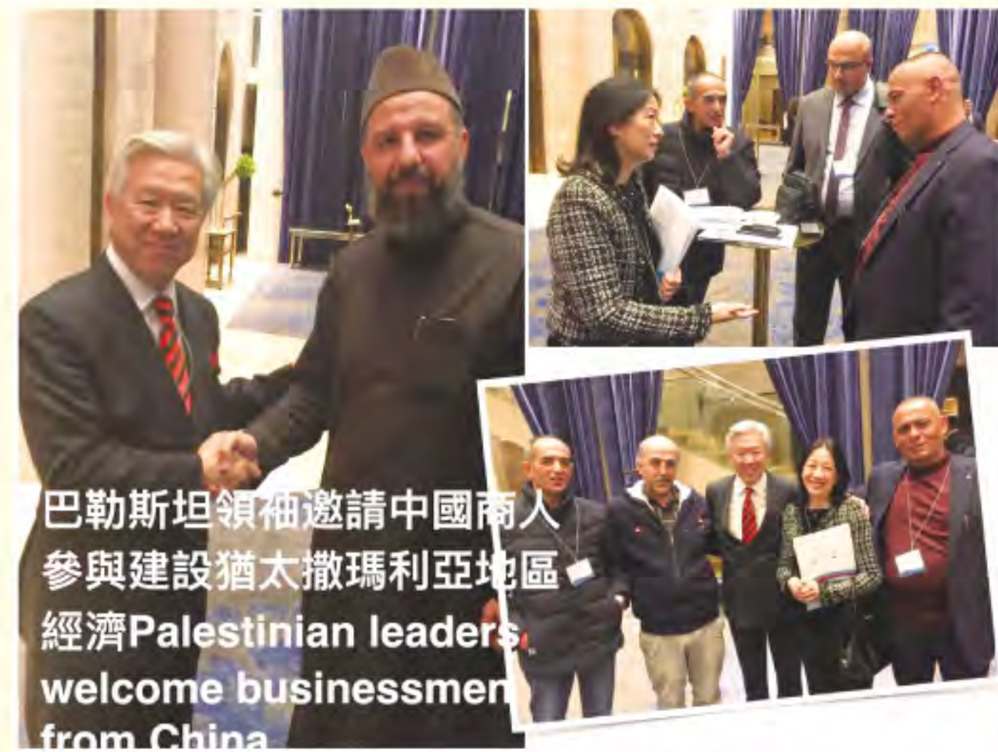
巴勒斯坦領袖邀請中國商人參與建設猶太撒瑪利亞地區經濟 Palestinian leaders welcome businessmen from China