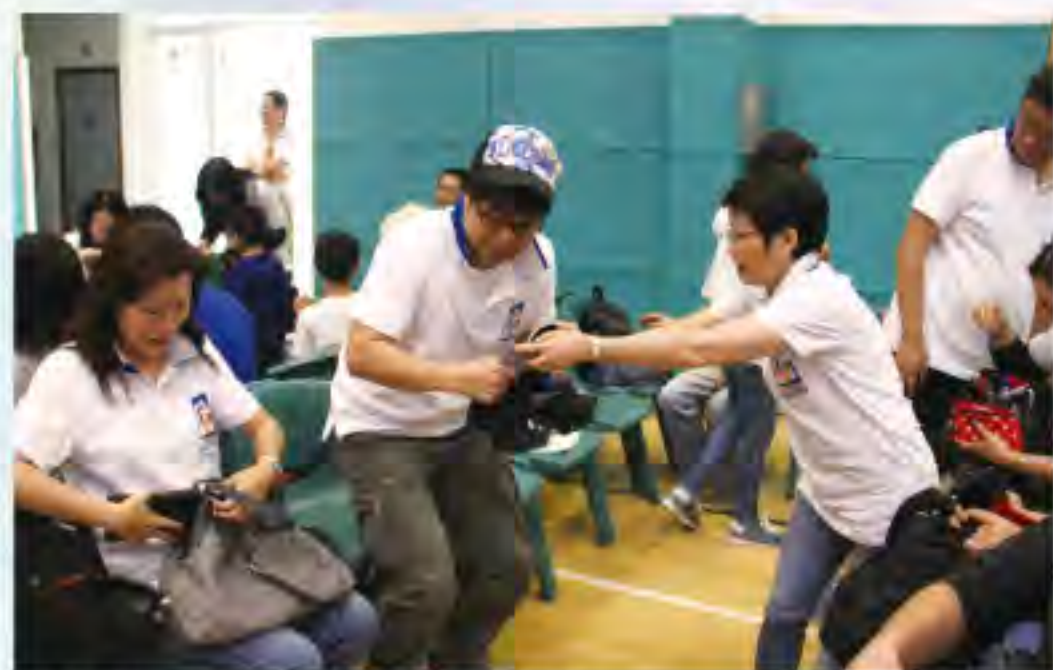
▲在教會與弟兄姊妹玩遊戲