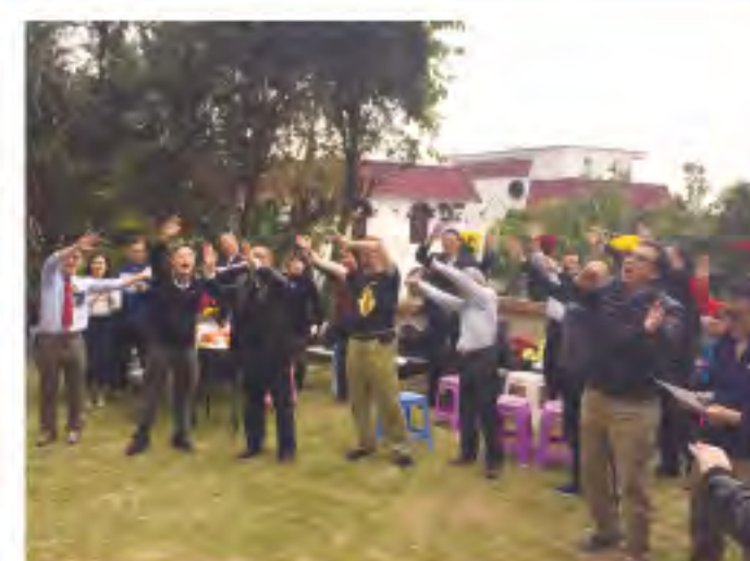
▲大家一同唱歌跳舞