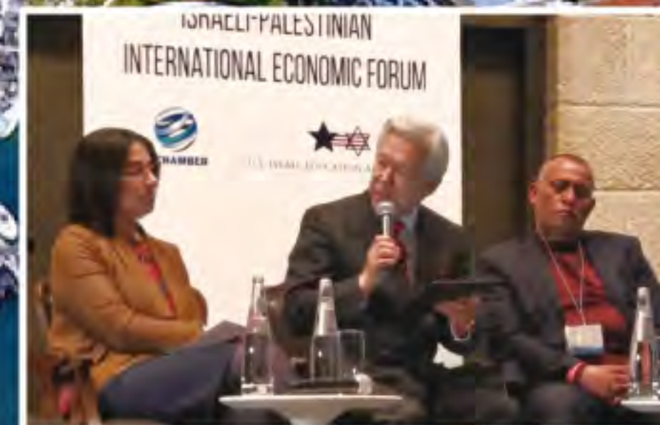
以色列巴勒斯坦經濟論壇