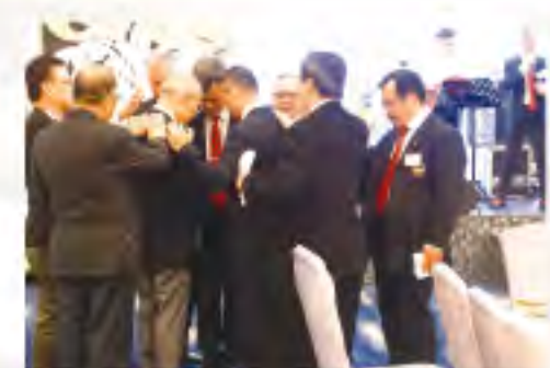
▲弟兄同心為餐會開始前祈禱