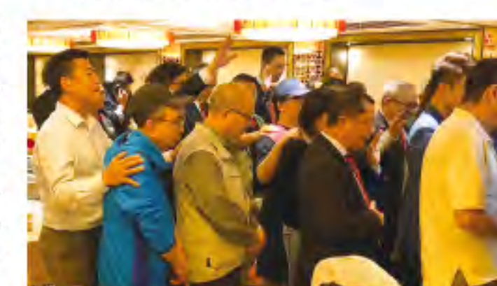
▲當晚有不少人士受感動上前決志信主