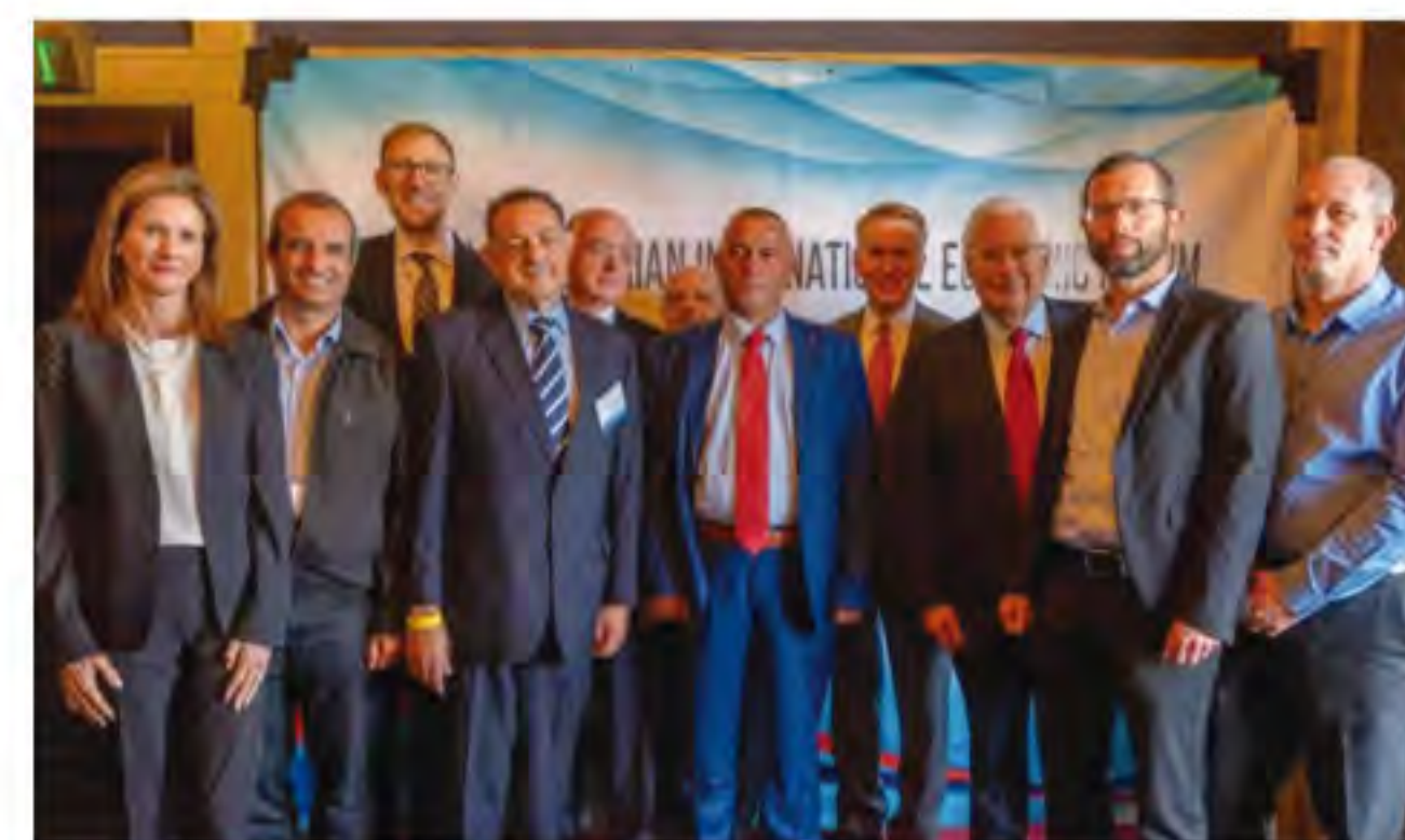
Meeting of Mayors and Mukhtars

Contact Editor Arutz Sheva Staff, 21/02/19 19:17