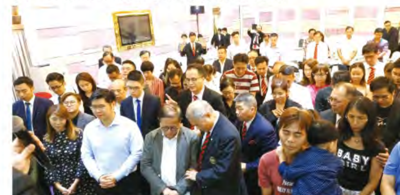
▲新來賓到台前決志信主