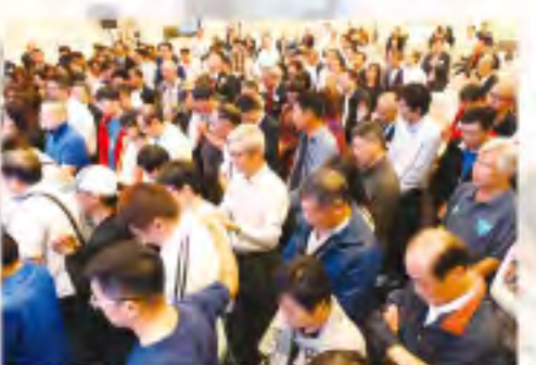
▲參加者到台前決志信主