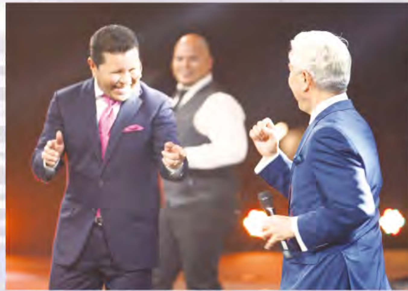
▲大家一起唱歌敬拜

他指出超自然遇見神的同在是需要 (1) 神親自啟動 (2) 我們主動去追求，甚至可以禁食禱告，渴望追求 (3) 神的榮耀同在，祂可以自行在我們身上運作，不需使用你或我去成事。而超自然的意義在於這是一個特別的、難以想像的經歷。神會出乎意料的用各種方法、各種形式來向人彰顯祂自己；每個人遇見神的形式都可以是獨一無二的。馬都納多牧師分享到自己曾在家中讀經的時候感受聖靈的同在，當時彷彿有水流溫暖的流過，神也在這時告訴他，這就是神源源不絕的愛。自此他看人的角度改變了，不再看輕他人，而是積極的想要帶人進到神的愛裡。