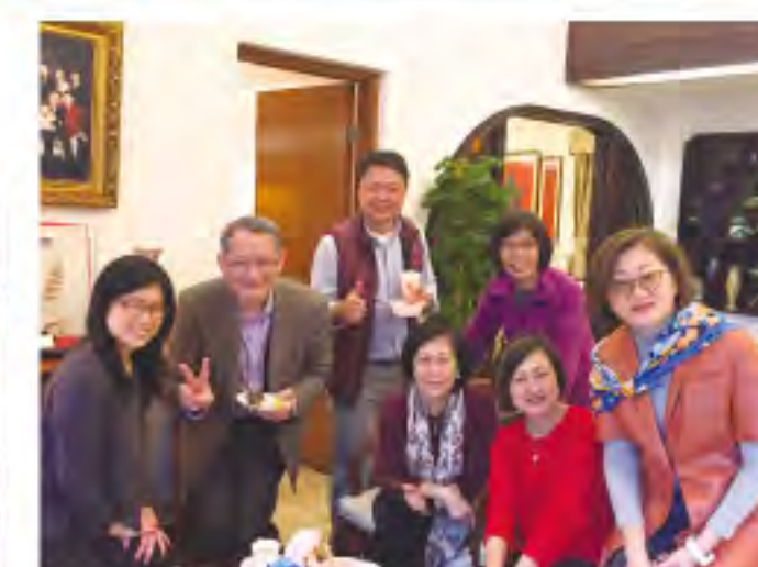
▲很多弟兄都帶同太太及女兒出席