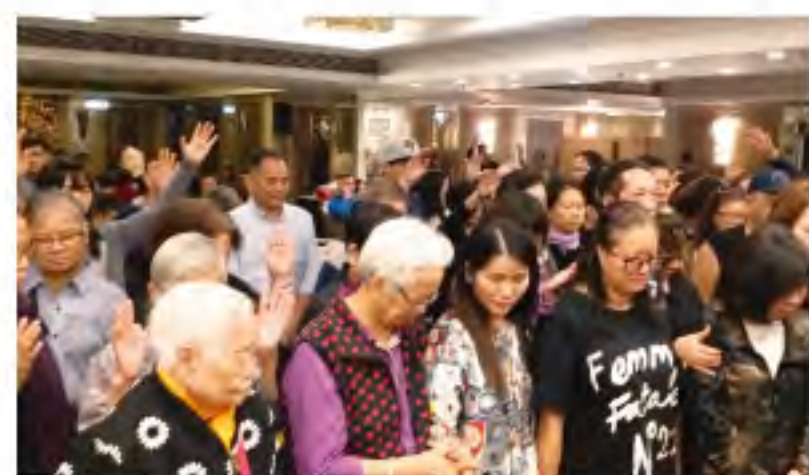
▲很多來賓走到台前作決志祈禱