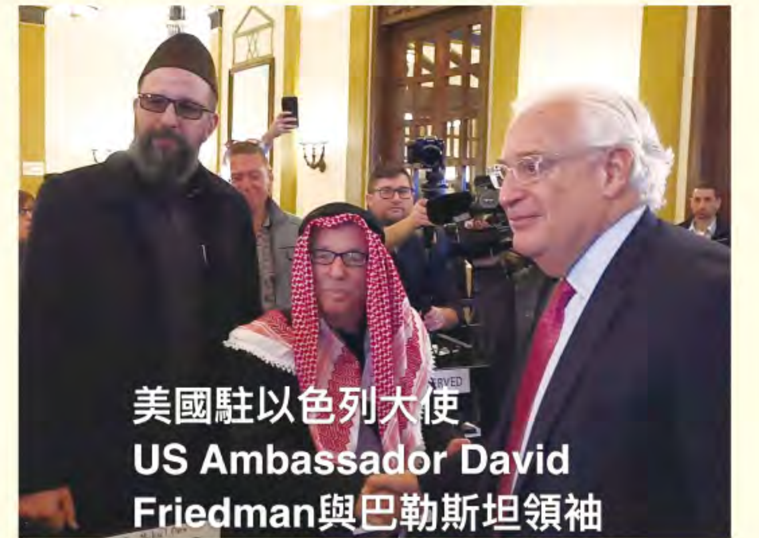
美國駐以色列大使 US Ambassador David Friedman與巴勒斯坦領袖

「有一天，我相信在不久的將來，我們開始看到以色列人和巴勒斯坦人一起工作，一起學習，共同投資，真正和平共處 - 不是來自一張紙上的'和平'，而是這裡每個人心中的真正平安。」