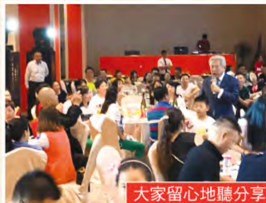
大家留心地聽分享