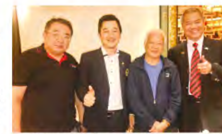
▲弟兄相聚十分高興