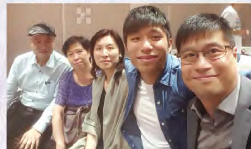
▲與爸爸、媽媽、太太及兒子在教會聚會

正當我找不到出路，甚至想了結生命時，主耶穌讓我看到一張大型海報上的經文『耶穌來是要叫人得生命，並且得的更豐盛』（約翰福音 10:10）。剎那間，我仿如醍醐灌頂！我哭了，心裡默默向耶穌禱告說：「我也想要豐盛的生命。」...時間彷彿回到了我中二的時候...我獨自一人在走廊徘徊...禱告...我知道主尋回了我。幾天後，一位多年沒有聯絡的小學同學突然相約吃飯，我雖然感到有點奇怪，但最終也選擇應約。步入酒樓時，我口裡還叼著一口香煙，可是看到酒樓內的情景時，嚇得連忙丟掉口裡的香煙。原來那不是一個普通的飯局，而是一個福音餐會。一群大男人快樂忘我地唱歌、跳舞、敬拜耶穌；那前所未見的場面深深地觸動了我。當我聽到一位男士見證主耶穌怎樣拯救他脫離荒唐放蕩的生活時，我想起了自己的處境，開始飲泣起來。我知道主來尋找我。不久後，我開始返教會，重投主耶穌的懷抱。