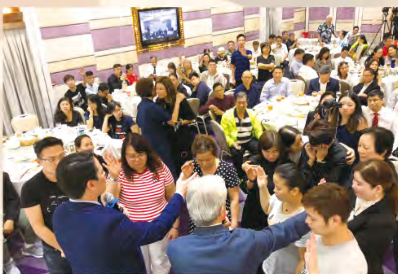
▲參加者去到台前決志信主