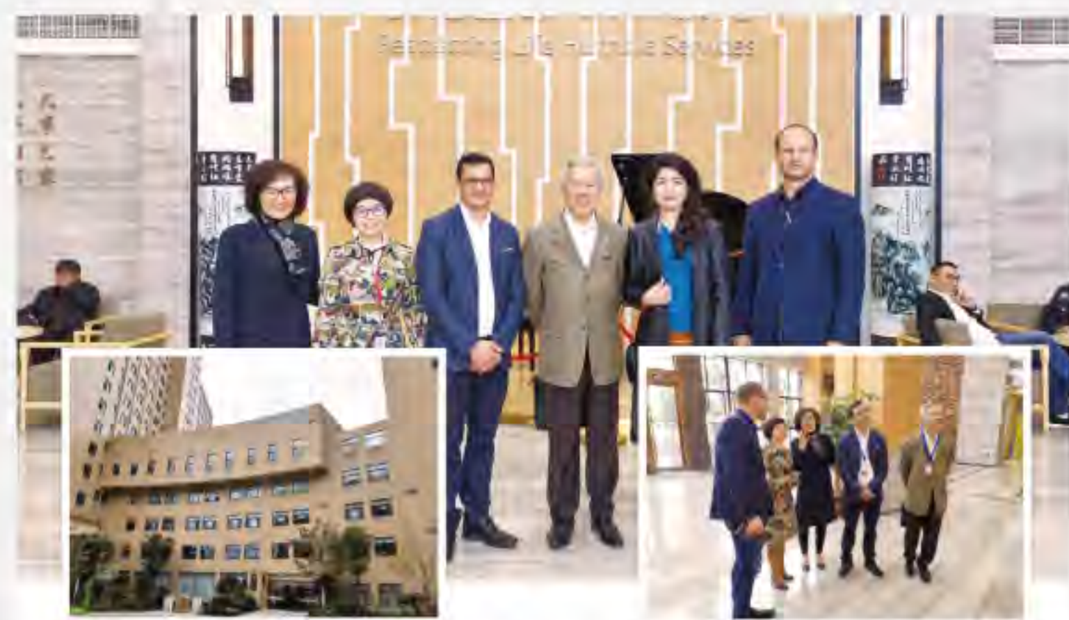
Mergon Group visiting Wenzhou Kangning Hospital 募根集團訪問著名溫州康寧醫院 (December 2018)

在一些經文中，avodah這個字意味著工作，就像在田間工作和勞動一樣。上帝說，「你六日要做工（avodah）第七日要安息。」（出埃及記34:21）。「人出去做工（avodah），勞碌直到晚上。」（詩篇104:23）。「耶和華這樣說，容我的百姓去，好事奉（英文worship敬拜或原文avodah）我。」（出埃及記8:1）「但至於我和我家，我們必定事奉（avodah）耶和華。」（約書亞記24:15）。這是一個強力的形象，avodah是一個整合信仰的圖畫。工作和敬拜來自同一根基的生活。