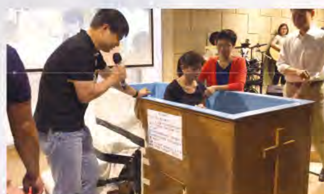
▲在教會浸禮儀式中為姊妹祈禱