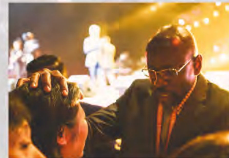
▲KJM團隊為參加者祈禱醫治

本次特會中神蹟見證不斷，包括多位耳聾的弟兄姊妹再次恢復聽力、身體的腫瘤消失無蹤、因病切除的甲狀腺重新長出來、中風6年無法行走的老太太重拾行動能力。在場無不驚喜歡呼，將一切的榮耀歸與上帝。