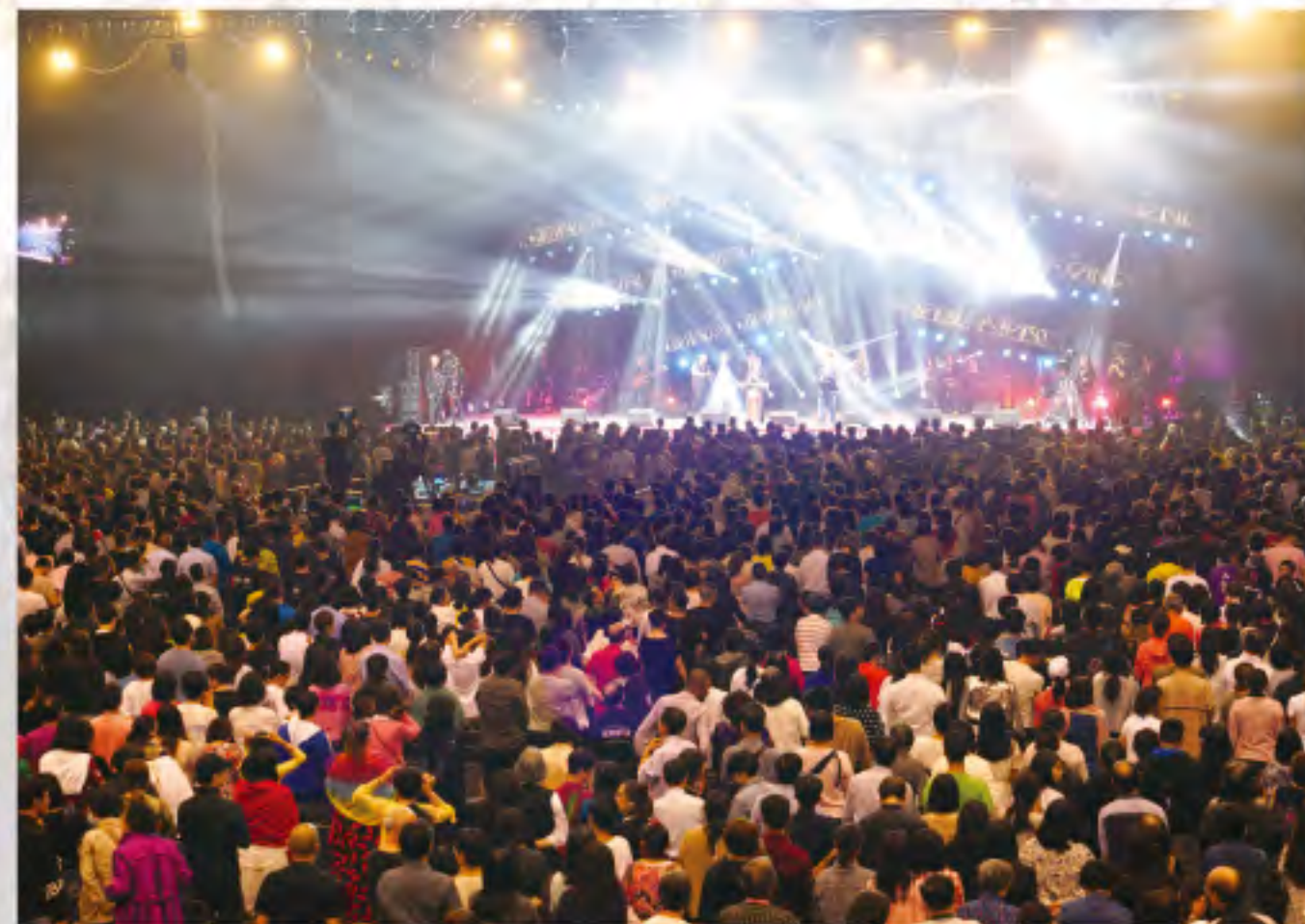
是次活動約有28,000人次參與