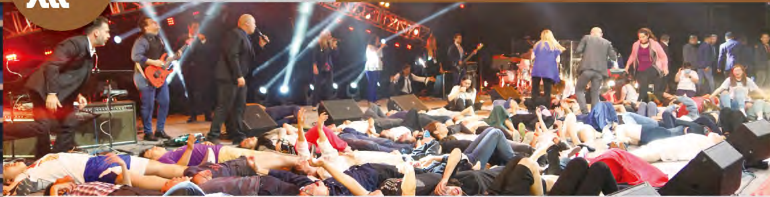
▲當天有很多人被醫治釋放