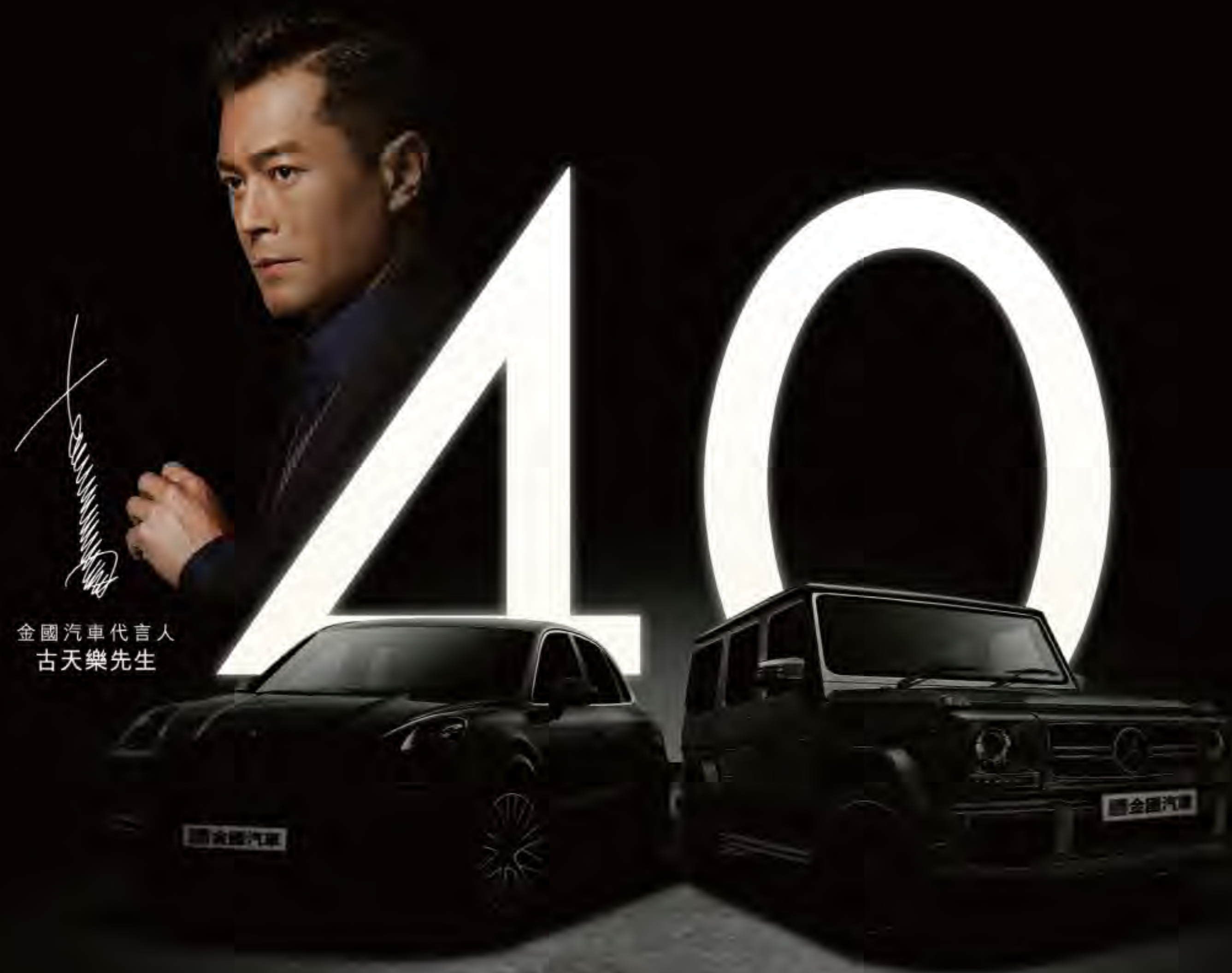
金國汽車代言人 古天樂先生