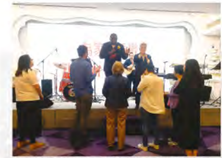
▲來賓走到台前接受醫治及祝福