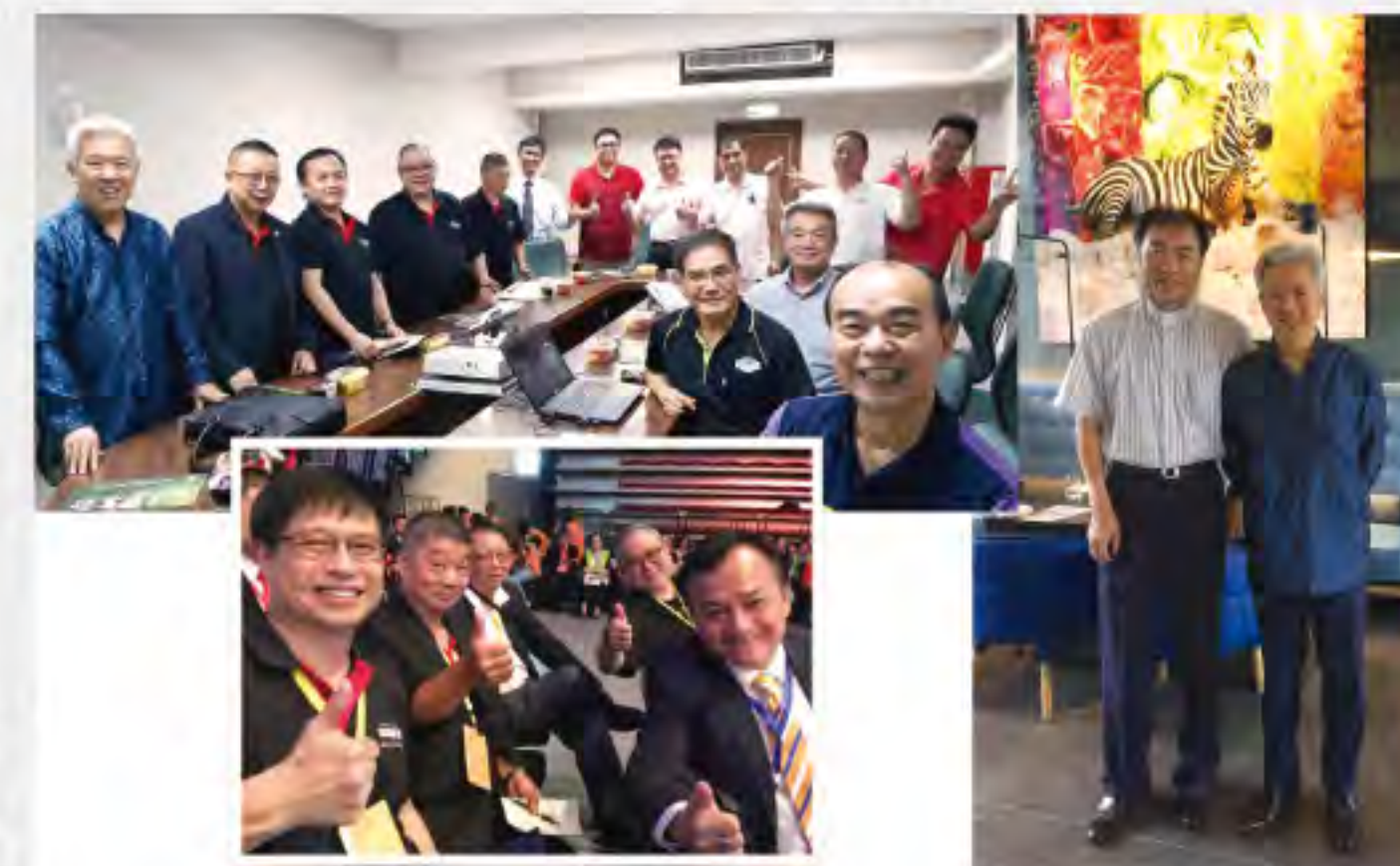
Visiting leading entrepreneurs at Taichung 香港FGB團隊於台中訪問著名愛心企業家 ( August 2018)