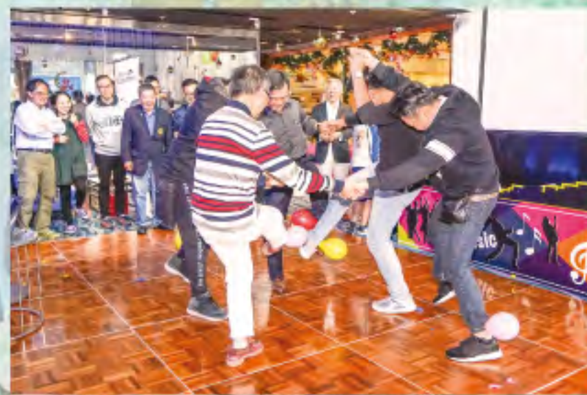
▲踩汽球遊戲競爭激烈